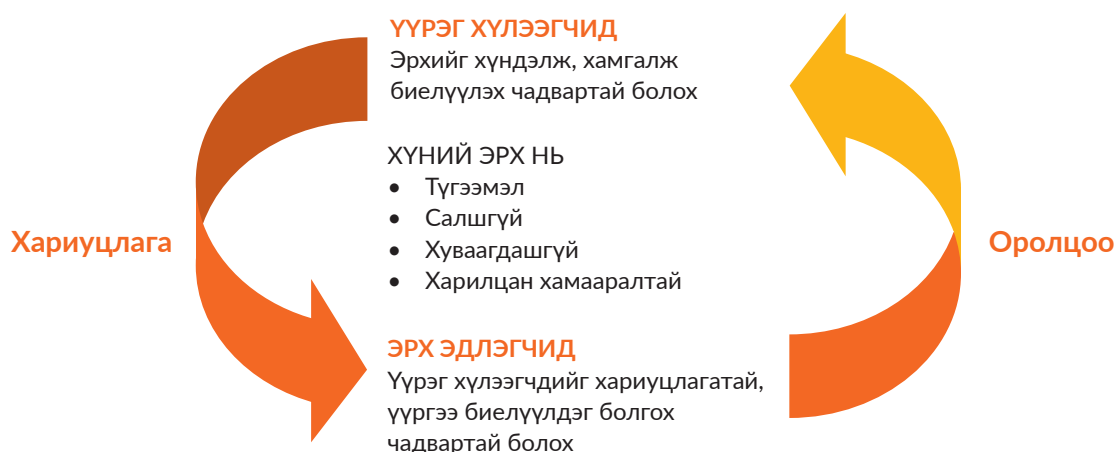
Зураг 1. Хүүхдийн эрхэд суурилсан хандлагын хоёр түлхүүр ойлголт

Зураг 1-т хариуцлага, оролцоо гэсэн ойлголтуудыг хүүхдийн эрхэд тулгуурласан хандлагын хоёр түлхүүр ойлголт болохыг дүрсэлсэн. Энэ хоёр ойлголтууд нь харилцан хамааралтай ойлголтууд.