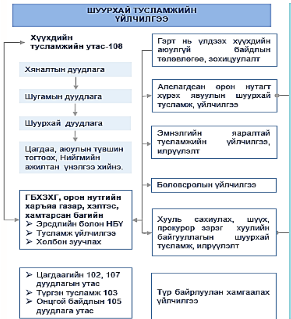
Зураг 5. Хамгаалах нөхөн сэргээх үйлчилгээ