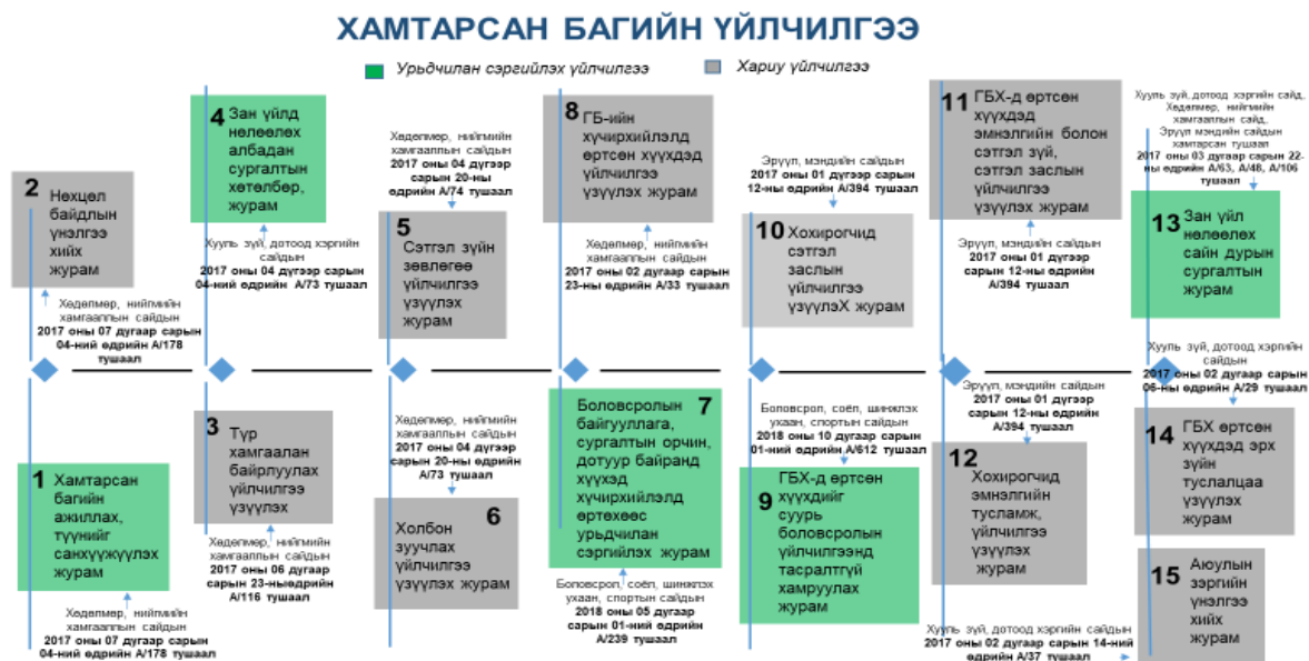
Зураг 3. Гэр бүлийн хүчирхийлэйн хохирогчийг хамгаалах, урьдчилан сэргийлэх, үйлчилгээ үзүүлэхтэй холбоотой эрх зүйн баримт бичгийн зураглал

Улсын хэмжээнд 2021 оны байдлаар 715 Хамтарсан баг нийт 6365 хүүхдийн хамгааллын кейс дээр ажилласан байна. Хамтарсан баг нь эрсдэлт нөхцөлд байгаа хүүхдэд нөхцөл байдлын үнэлгээнд үндэслэн дараах 7 төрлийн үйлчилгээг үзүүлнэ. Үүнд: