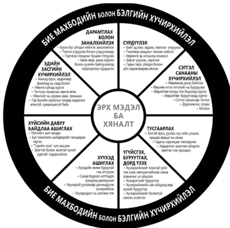
Зураг 2. Хүчирхийллийн зураглал 13

Хуульд хүүхдийг гэр бүлийн хүчирхийллээс хамгаалахаас гадна хүүхдийг эрсдэлт нөхцөлд оруулсан, үл хайхарсан зэрэг хүчирхийллийг илрүүлж, тусгай хамгаалалтаар хангах асуудал туссан байна.